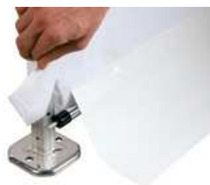
Immagine di parete QUALYTENT Premium con barra stabilizzatrice opzionale.

Tutte le rifiniture sono curate con attenzione fin nei minimi dettagli. Ogni tenda viene garantita per qualità e robustezza con il marchio QUALYTENT .